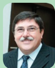
Coluna sob a responsabilidade de Roberto Pino de Jesus

maior, o pai terá direito a até duas folgas remuneradas para acompanhar a gestante em consultas médicas e um dia por ano para levar o filho de até seis anos ao médico.