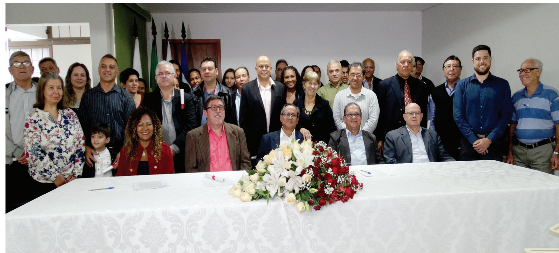
Em 18 de Maio foi realizada a cerimônia de posse dos membros na nova diretoria do Sindicato dos Trabalhadores nas Indústrias de Alimentação de Maringá. O evento ocorreu no Auditório "João Gabriel" na sede da própria entidade. O presidente da Federação dos Empregados em Indústrias de Alimentação do Estado do Paraná (Feapar), Antônio Sérgio Farias, presidiu a cerimônia. PÁGINAS 4 E 5