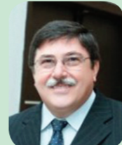
Coluna sob a responsabilidade de Roberto Pino de Jesus

Em Maringá, calcula-se que cerca de sete mil pessoas participaram do ato